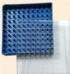
Kunststoffboxen aus Polycarbonat