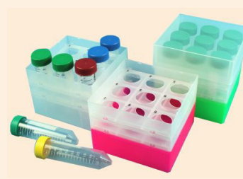
Kunststoffboxen aus Polypropylen