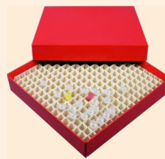
Boxen und Rastereinsätze aus Karton