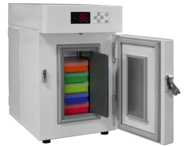
ProfiLine Pegasus PLPE 0186EWN (optional mit Ordnungssystem, sehen Sie dazu den separaten Katalog)