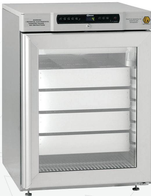
BioCompact II RR210.

Klik hier voor meer informatie op vonmarcken.nl