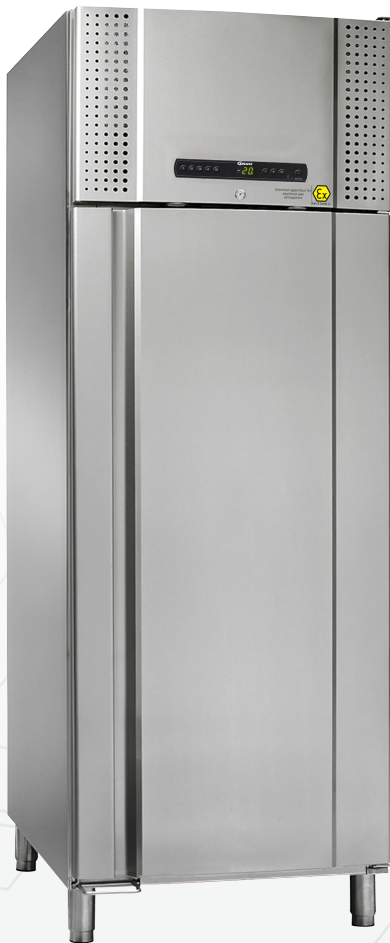
BioPlus 930 Laden en overig interieur zijn als optie verkrijgbaar.

De BioPlus 930 serie is uitermate geschikt voor het bewaren van temperatuurgevoelige producten, waarbij iedere temperatuurschommeling grote invloed kan hebben op de producten.