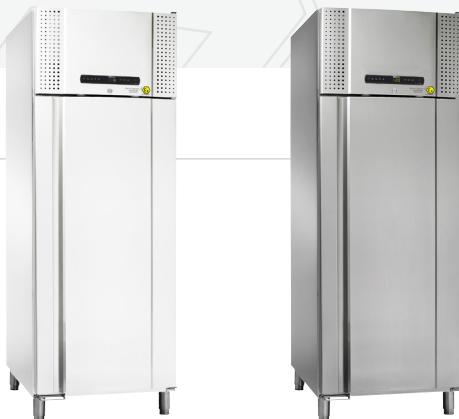
De BioPlus 930 is verkrijgbaar als koelkast of vrieskast in het wit of in roestvaststaal. Keuzemogelijkheid in glasdeur (alleen bij koeling) of dichte deur.

De meubelen zijn ook leverbaar zonder compressor voor separate aansluiting of op een centraal systeem.