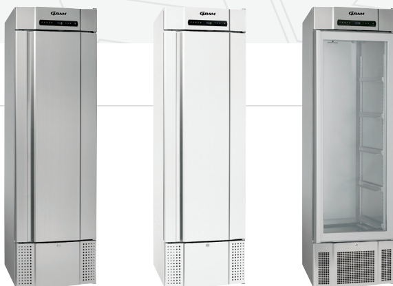
De BioMidi 425 is verkrijgbaar als koelkast of vrieskast in het wit of in aluminium/roestvaststaal. Keuzemogelijkheid in glasdeur (alleen bij koeling) of dichte deur.

De meubelen zijn ook leverbaar zonder compressor voor separate aansluiting of op een centraal systeem.