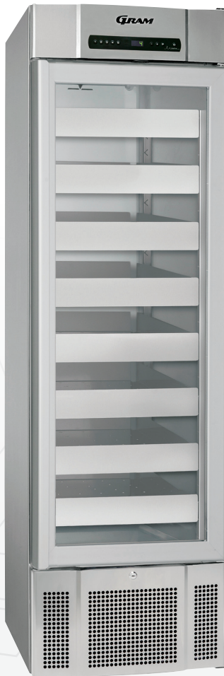
BioMidi 425. Lades en glasdeur als optie mogelijk.

De BioMidi 425 kasten zijn uitermate geschikt voor de opslag van farmaceutische producten.