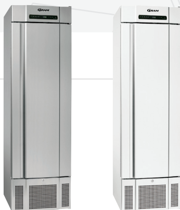
De BioMidi EF 425 is verkrijgbaar in het wit of aluminium/roestvaststaal.

Het functionele design verzekert een ergonomisch gebruik van de opslagruimte.