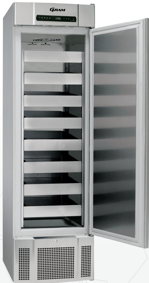
BioMidi EF425. Lades als optie mogelijk

De BioMidi EF425 is een lage temperatuur vriezer met een temperatuurbereik tussen -5/-40^{\circ} C. Het hoge-capaciteits koelsysteem waarborgt een snel herstel van de temperatuur in de binnenruimte van de kast na deuropening.