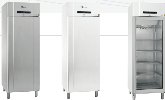
De BioCompact II 610 is verkrijgbaar als koelkast of vrieskast in het wit of in roestvaststaal.