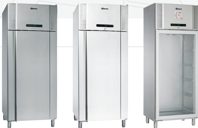
De BioBlood 600/660W is verkrijgbaar als koelkast of vrieskast in het wit of in roestvaststaal. Keuzemogelijkheid in glasdeur (alleen bij koeling) of dichte deur.

De meubelen zijn ook leverbaar zonder compressor voor separate aansluiting of op een centraal systeem.