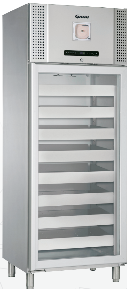
BioBlood 600/600W Laden en chart recorder zijn als optie verkrijgbaar.

De BioBlood 600/660W serie is specifiek voor het bewaren van bloed, plasma en aanverwante producten.