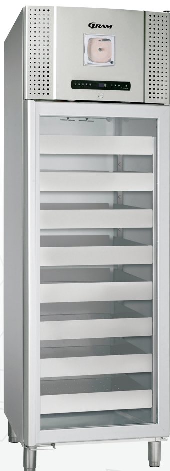
BioBlood BR660D. Lades en glasdeur als optie mogelijk.

Klik hier voor meer informatie op vonmarcken.nl