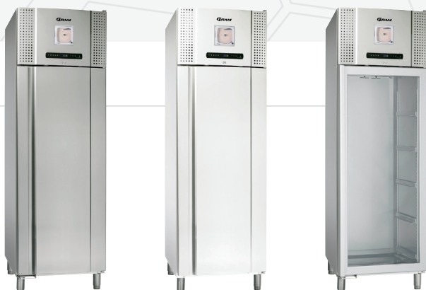
De BioBlood 600/660D is verkrijgbaar als koelkast of vrieskast in het wit of in roestvaststaal. Keuzemogelijkheid in glasdeur (alleen bij koeling) of dichte deur.

De meubelen zijn ook leverbaar zonder compressor voor separate aansluiting of op een centraal systeem.