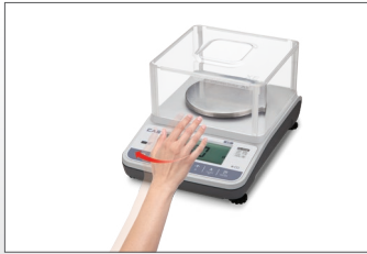
Tarreren zonder de balans aan te raken

Checkweegfunctionaliteit Tijdscherm met weegfunctie