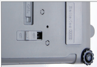
Loadcell lock voor veilig transport

VONMARCKEN LABORATORY & MEDICAL EQUIPMENT