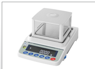
Optioneel met glazen stofkap