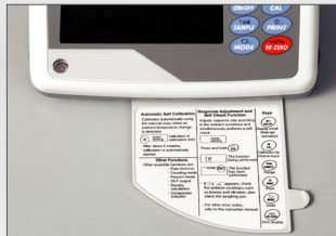
Handleiding voor dagelijks gebruik